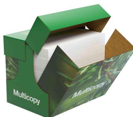
Papier multifonction MultiCopy, MaxBox