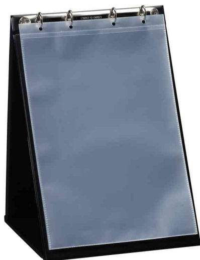
Chevalet de table, A4 portrait