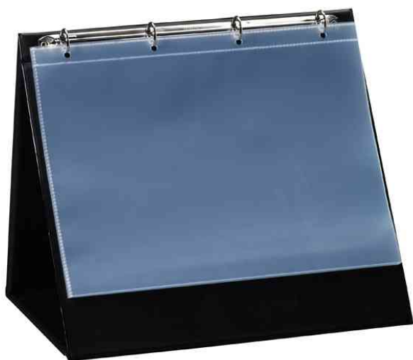
Chevalet de table, A4 paysage