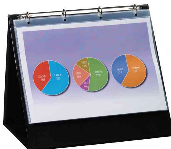
Chevalet de table, A4 paysage, exemple d'utilisation