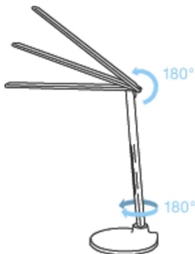
Visuel de référence : Vue détaillée