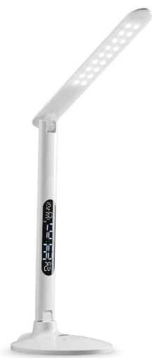
Lampe de bureau à LED strato

La lumière doit également être orientée à la verticale de manière à ce que le poste de travail soit éclairé de manière douce et claire.