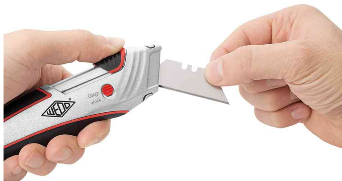
Vue détaillée: rechange de lame