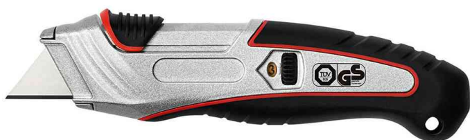
Safety-Cutter pro à 3 hauteurs de lame