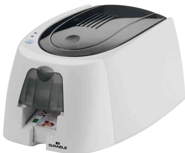
Imprimante de cartes DURACARD ID 300