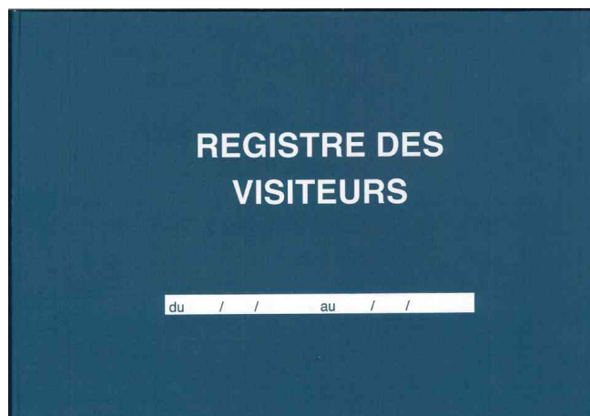
Registre des visiteurs

- permet de conserver une trace fiable de toute personne se rendant dans votre établissement.- la qualité du tracé met en valeur l'accueil au sein de la société- archivage facilité grâce à l'inscription des périodes d'utilisation sur le plat de couverture et sur le dos