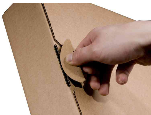
Fermeture à patte rentrante