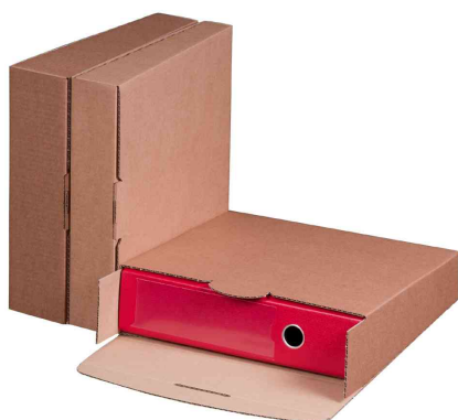
Visuel de référence: carton d'expédition de classeur, marron - livraison non équipée