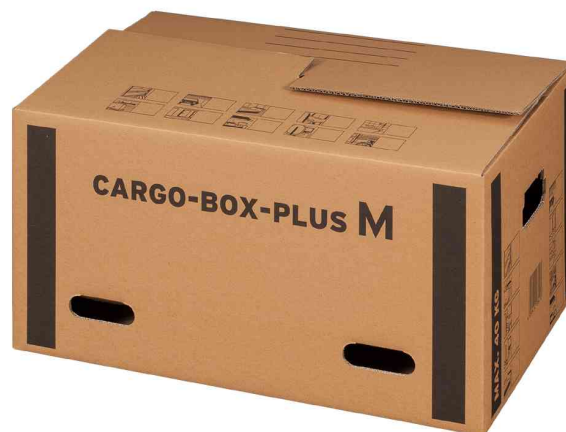
Carton de déménagement "CARGO-BOX-PLUS M"