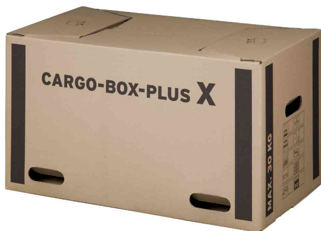
Carton de déménagement "CARGO-BOX-PLUS X"