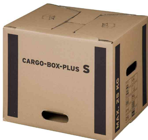
Carton de déménagement "CARGO-BOX-PLUS S"