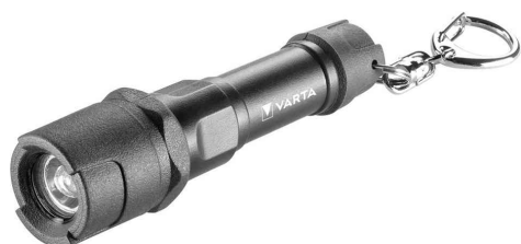
Lampe de poche "Indestructible Key Chain"