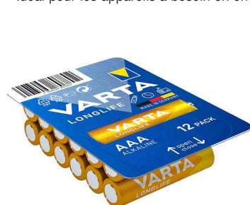
Pile alcaline Longlife BIG BOX, Micro (AAA), 12 pièces

- idéal pour les appareils à besoin en énergie faible et constant tels que les jouets, télécommandes, horloges murales ou radios