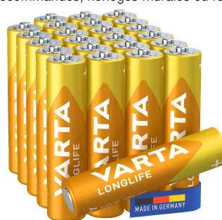
Pile alcaline Longlife, Micro (AAA)