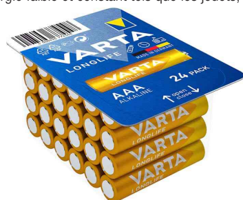
Pile alcaline Longlife BIG BOX, Micro (AAA), 24 pièces