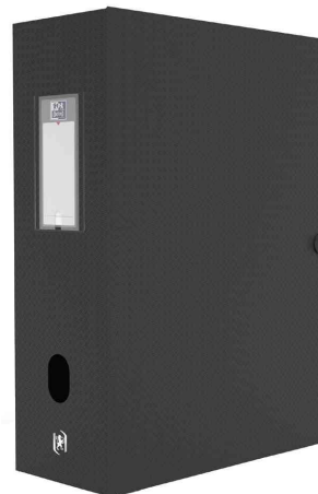
Boîte de classement MEMPHIS, avec bouton-pression, noir