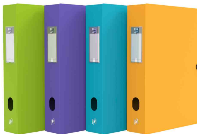
Visuel de référence: Boîte de classement MEMPHIS, assorti Style