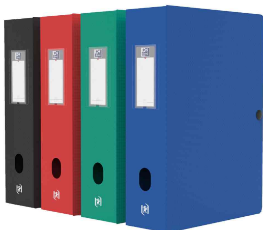
Visuel de référence: Boîte de classement MEMPHIS, assorti Classique