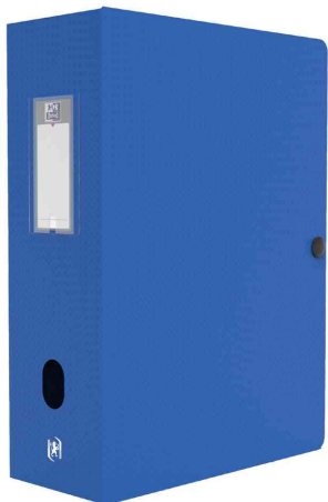
Boîte de classement MEMPHIS, avec bouton-pression, bleu

couleurs assorties Classique: assorti dans les couleurs: bleu, noir, rouge, vert, vendu uniquement au conditionnement