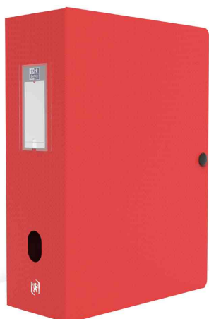
Boîte de classement MEMPHIS, avec bouton-pression, rouge