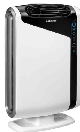
Purificateur d'air AreaMax DX95