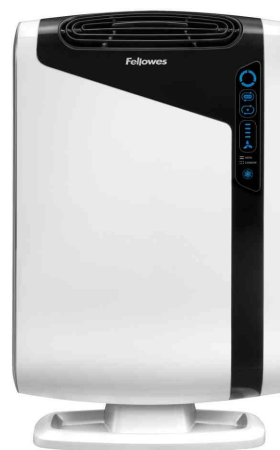
Purificateur d'air AreaMax DX95