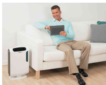
Purificateur d'air AreaMax DX95