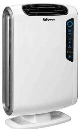
Purificateur d'air AeraMax DX55