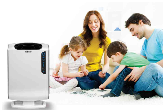
Purificateur d'air AeraMax DX55, utilisation