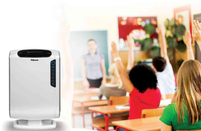
Purificateur d'air AeraMax DX55, utilisation