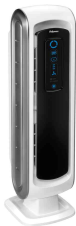
Purificateur d'air AeraMax DX5