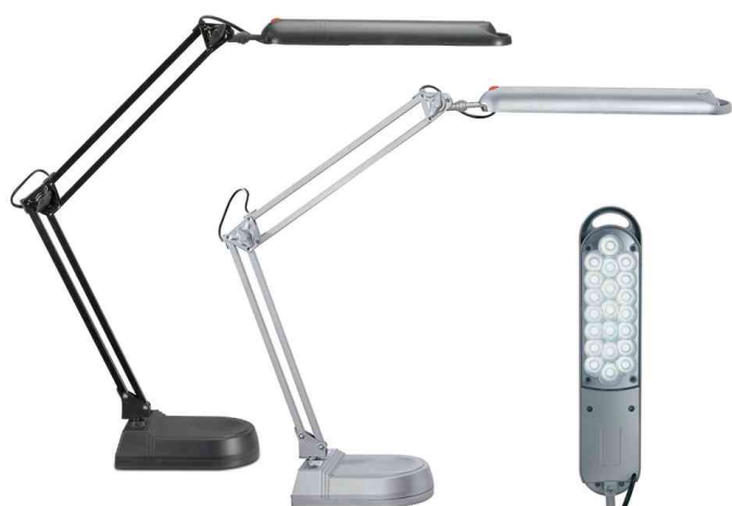
Visuel de référence: Lampe de bureau à LED MAULatlantic, avec socle