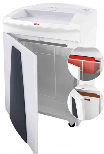
Detailansicht: Unterschränk mit Tür