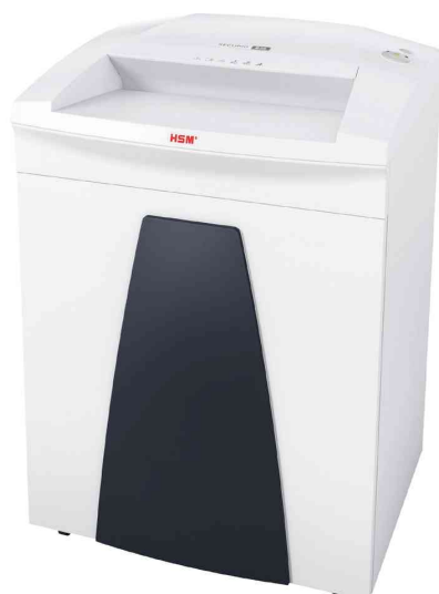
Destructeur de documents HSM SECURIO B35

- adapté pour plusieurs personnes dans un bureau