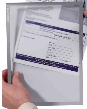
Pochette magnétique IT X-tra!Line, gris