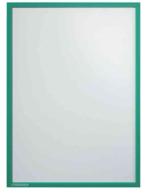
Pochette magnétique IT X-tra!Line, vert