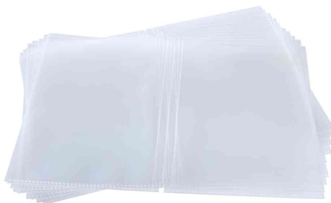
Accessoire : Double-pochette