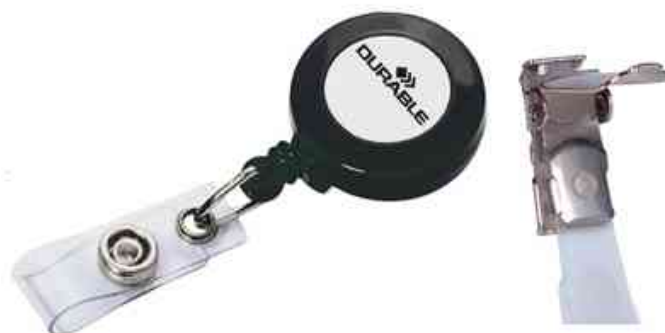
Accessoires: porte badge - clip de réchange