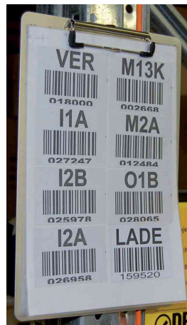
plaque en aluminium avec pince et bande magnétique, exemple d'utilisation