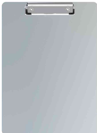
Porte-bloc, en aluminium avec pince et bande aimantée