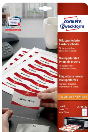
Visuel de référence: Étiquettes pour badges, microperforées