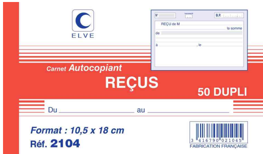
Manifold - Reçu