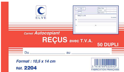
Manifold - Reçu, avec T.V.A