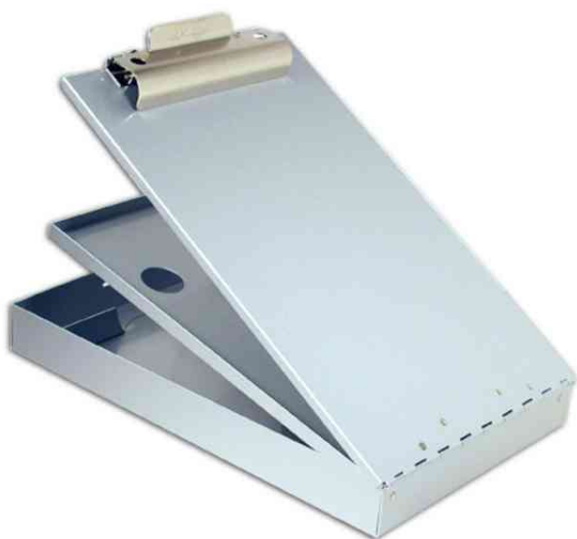
Porte-bloc avec compartiment pour formulaire Cruiser Mate