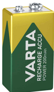
Pile "RECHARGE ACCU Power"

- convient à toutes les applications standard quotidiennes comme les talkies-walkies, les appareils de test, les détecteurs de fumée, les microphones, etc.