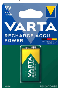
Pile "RECHARGE ACCU Power", emballage