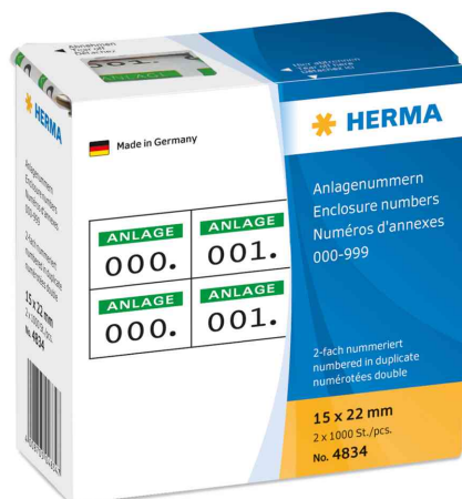
Visuel de référence: Numéros d'annexes, dans un distributeur en carton