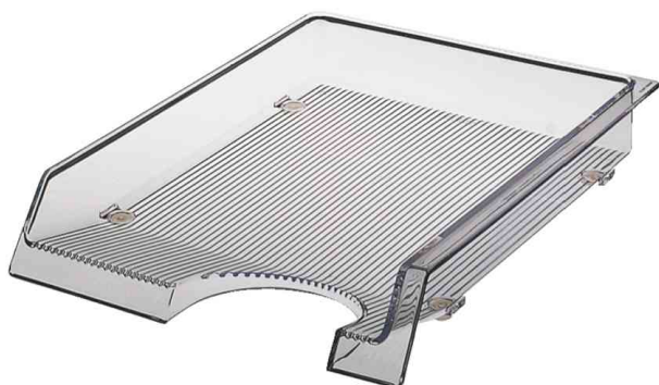
Corbeille à courrier Exclusiv, transparent