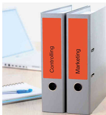
Etiquettes pour dos de classeur, utilisation