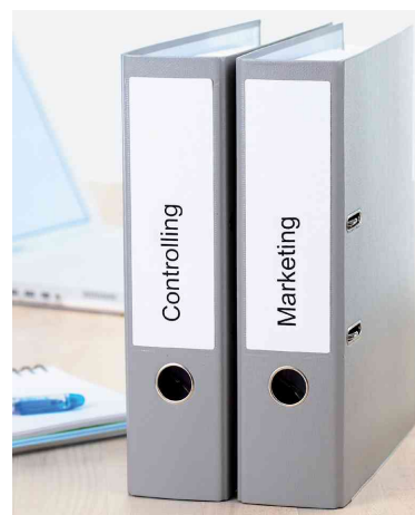
Etiquettes pour dos de classeur SPECIAL, utilisation