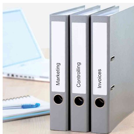
Étiquettes pour dos de classeur SPECIAL, utilisation