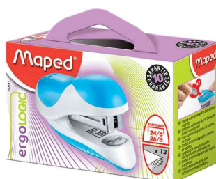
Agrafeuse Ergologic Mini, dans un carton