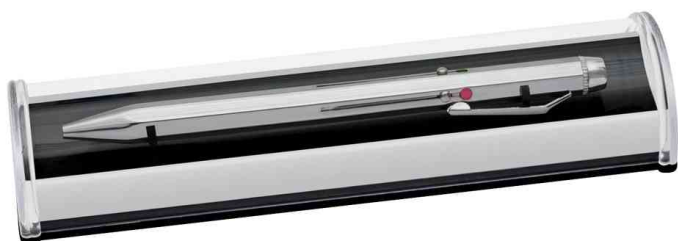
Stylo à bille 4 couleurs, dans un étui