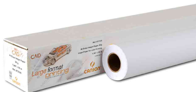
Visuel de référence: Papier pour traceur jet d'encre - HiColor jet d'encre