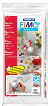
Pâte à modeler, blanche