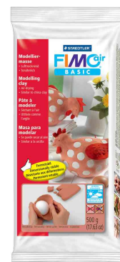
Pâte à modeler, terre cuite