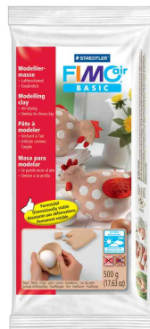
Pâte à modeler, couleurs de peau