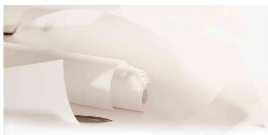
Papier à dessin "C" à grain, en rouleau