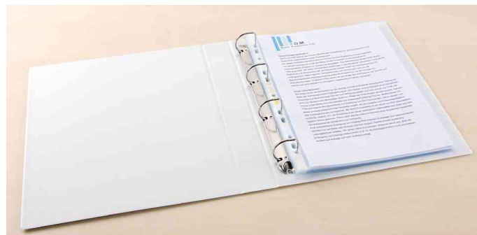
Visuel de référence: Exemple d'utilisation