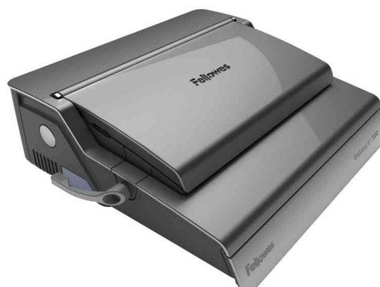
Perforeur électrique à anneaux plastiques Galaxy E 500, fermé