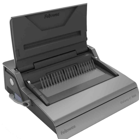
Perforeur électrique à anneaux plastiques Galaxy E 500