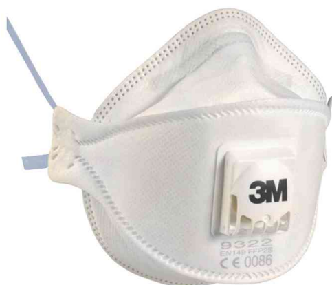
Masque de protection respiratoire serie 9300

Ce masque ne correspond pas aux prescriptions des autorités sanitaires dans le cadre de la lutte contre la Covid-19