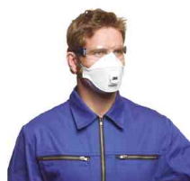
Masque de protection respiratoire serie 9300, média-filtrant innovatif - design 3 pièces - soupape expiratoire Cool-Flow