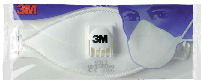
Masque de protection respiratoire 9300, emballage unique