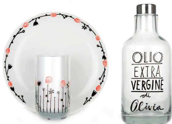
Visuel de référence: exemple d'utilisation