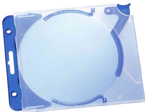
Boîtier CD/DVD QUICKFLIP® complete