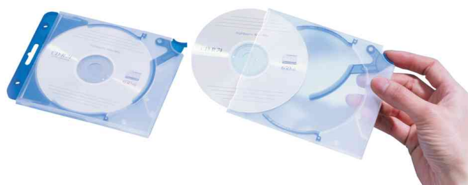
Mécanisme à levier intégré