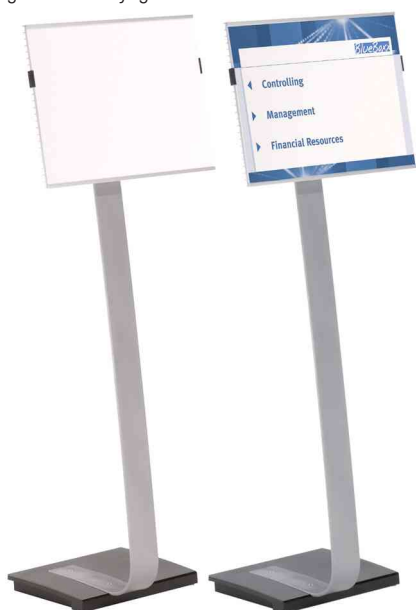
Support d'informations INFO SIGN Stand, format à l'italienne