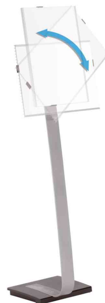
Pivote du format portrait au format paysage