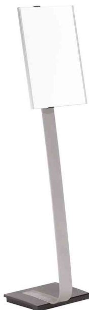
Support d'informations INFO SIGN stand, format à la française