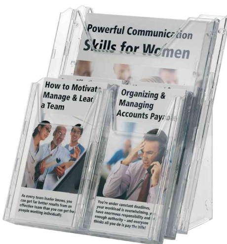
Système de présentation COMBIBOXX pro, présentoir de table