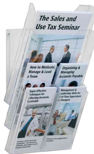
Système de présentation COMBIBOXX pro, présentoir mural