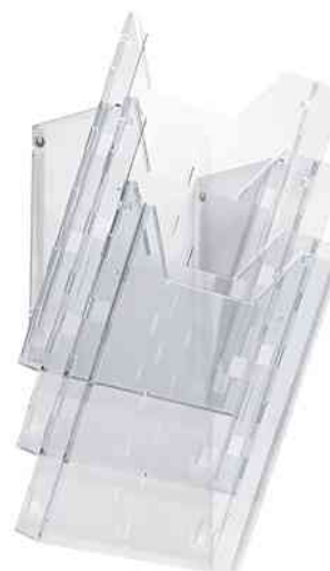
Porte-brochures - système COMBIBOXX A4 SET L, porte-brochures mural