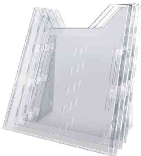
Porte-brochures - système COMBIBOXX A4 SET L, porte-brochures de table