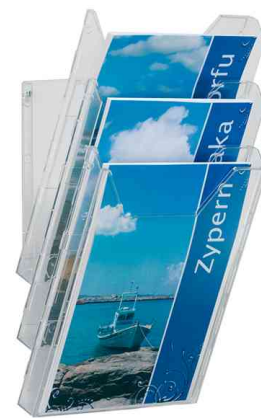
Porte-brochures - système COMBIBOXX A4 SET L, exemple d'utilisation