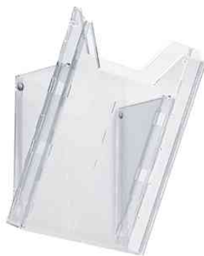
Système de porte-brochures COMBIBOXX A4, présentoir mural