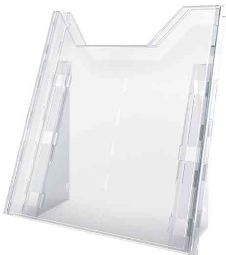
Système de porte-brochures COMBIBOXX A4, présentoir de table