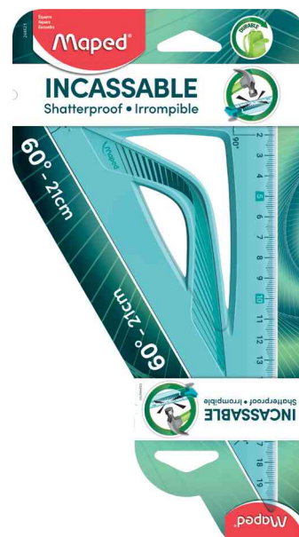
Visuel de référence: Equerre Flex 60°, 210 mm