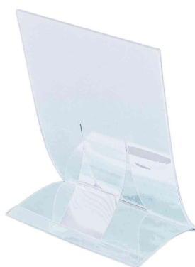
Présentoir de table, rabattable - vue arrière