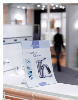
Présentoir de table, rabattable - Exemple d'utilisation