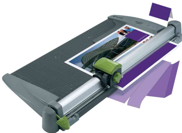
Massicot à roulette SmartCut A535pro