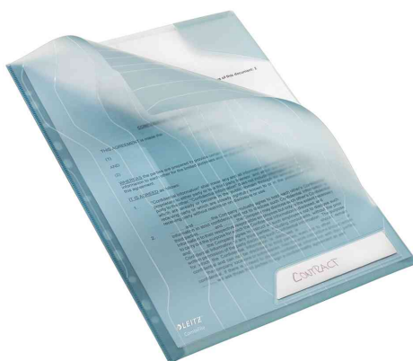
Languette de fermeture