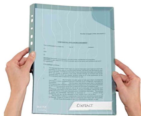
Rabat de bord perforé