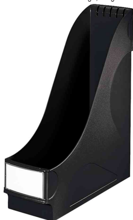
Porte-revue extra large, noir