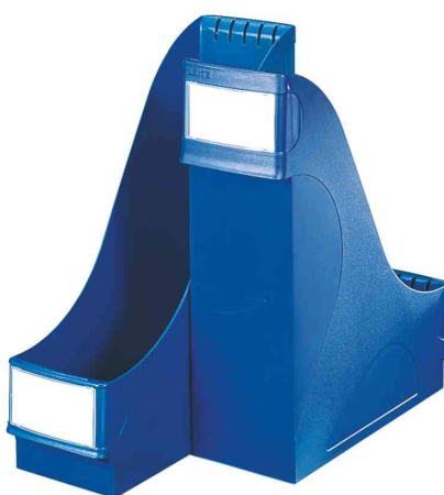
Porte-revue extra large, bleu