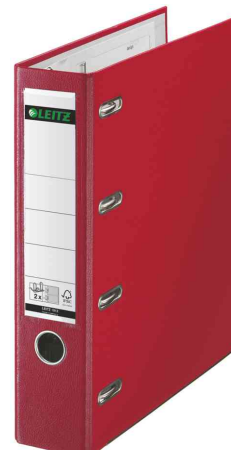
Classeur double en plastique, rouge