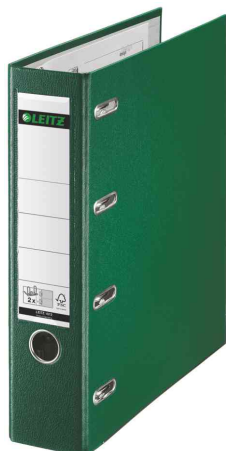
Classeur double en plastique, vert