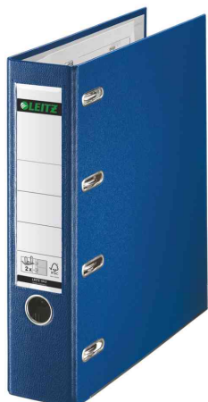
Classeur double en plastique, bleu