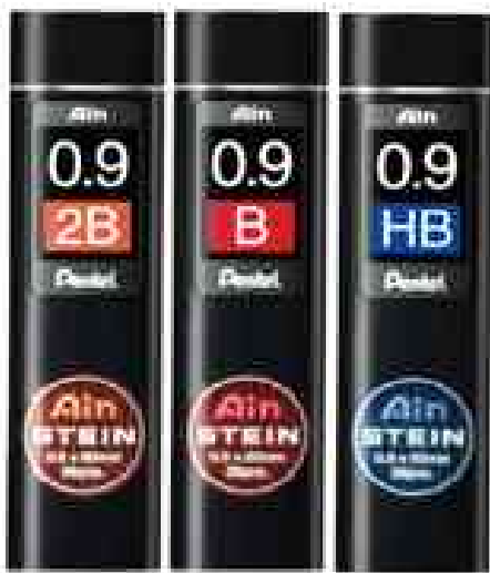
visuel de référence: Porte-mines AIN STEIN - 0,9 mm